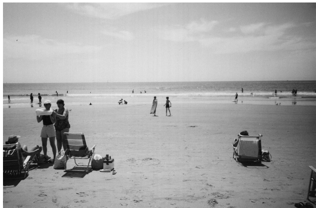
Härliga beacher fann vi i Narragansett RI.

Färden fortsatte nu på underbart vackra småvägar ner igenom Connecticut. Landskapet var böljande och skiftande med bondgårdar och små vackra byar. Det såg ut precis som vi hade förväntat oss. Husen var i allmänhet vita med liggande panel, och ofta prydda av något lustigt torn, eller någon avvikande tillbyggnad. Vi såg också mycket boskap, det märktes att detta var en i högsta grad levande landsbygd.