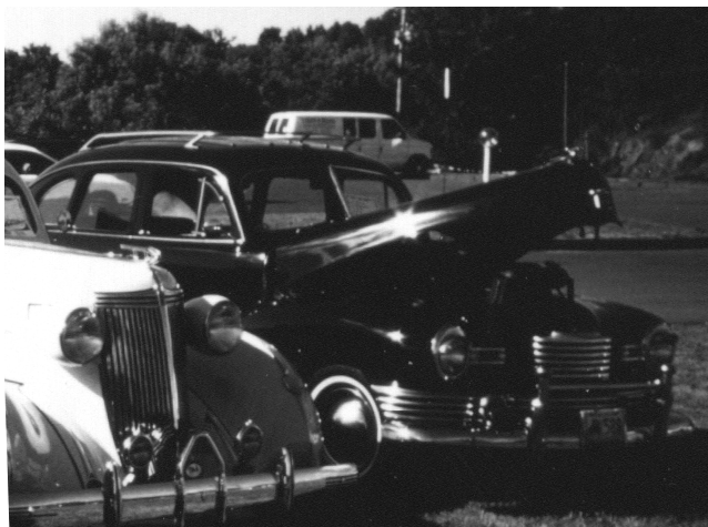
Den svarta Nashen hade rejäla stötfångare.

Bränslefiltret togs bort och det var smutsigt. Nash farbrorn plockade fram en pappersservett som han svepte över filtret innan han började blåsa det rent, så han blev högröd i ansiktet. Bara gubben inte får hjärtattack tänkte jag för mig själv. Medan vi skruvade som bäst hade ytterligare några själsfränder sällat sig till vår skara, bland annat gubbens fru som kom i en fräsig röd Ambassador cab från 65, givetvis körde den tuffa damen nercabbat. Tyvärr hade hon dubbelparkerat, och rätt vad det var stod vår kompis från den lokala ordningsmakten där och gormade igen. "Vad i h-vete är detta, har ni party här eller vad? Nu har jag tröttnat på att vara snäll, packa er iväg ögona böj, annars skall här skrivas böter som aldrig förr".