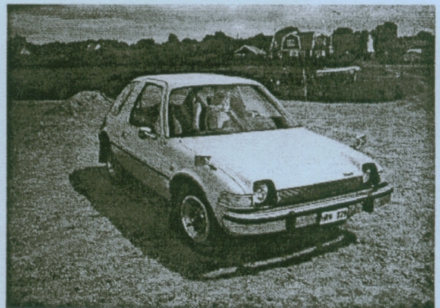
S.A.R.S. Euromeet 1997