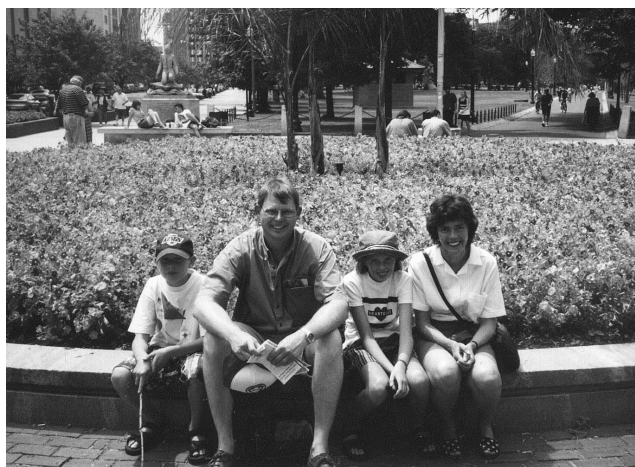
Freedom Trail startar vid Boston Common, en stor park mitt i staden.

Efter en liten stund gav vi oss iväg, Åsa fick åka med tanterna, medan jag och barnen trötta följde efter i Fisken.