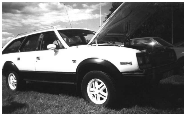
80-TAL: Eagle -82, Jouni Mikkola

Det var bl.a. en American-cab från -61 med, alldeles nyintagen från USA. Den var mysig!