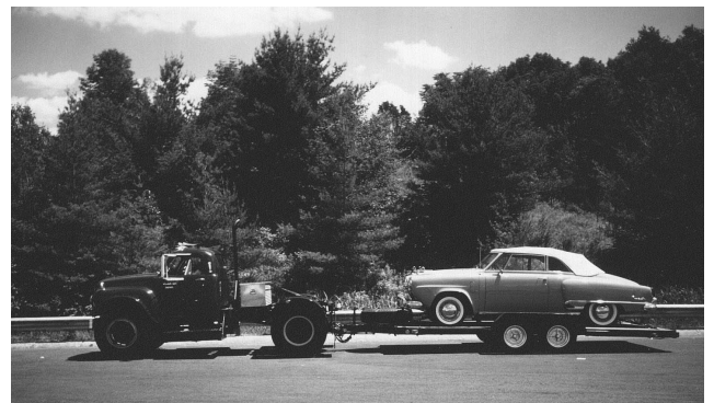
Tuff Studebaker truck, med snygg Studebaker Cab på trailern.

I början gick allt bra och vår lilla karavan rullade på mot öster längs tullvägen Massachusetts turnpike. Men efter en timme hände det som inte fick hända. Marlin puffade till ett par gånger och stannade sedan helt. Jag höll in på vägrenen och de andra också, inte bara de förresten, vår Rambler/AMC skara hade utökats betydligt längs vägen. Alla från träffen som skulle mot kusten slog följe med oss, varefter de kom ikapp. Flera som kom fram för att kolla vad som hänt var mekaniker, och alla kunde givetvis AMC-bilar.