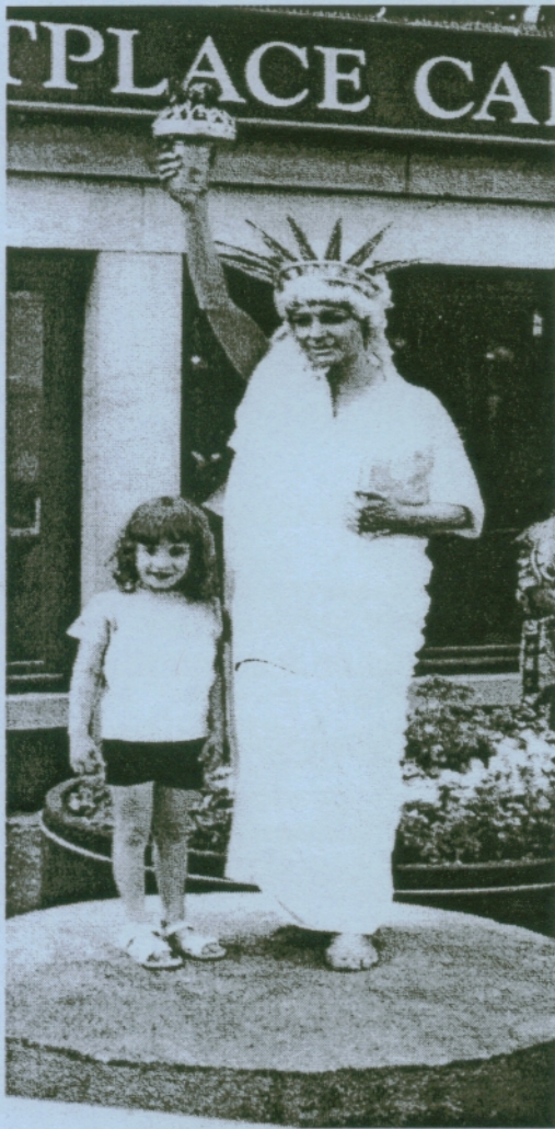
Go West - AMC Style 2

Medlemstidning för Svenska AMC/Rambler Sällskapet