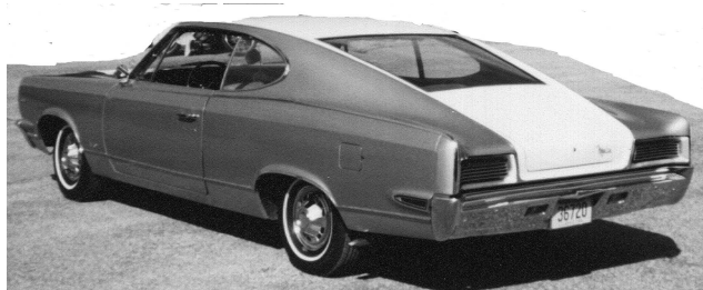
Trött Marlin fick vila i garage ett par nätter i Boston. (Det blev inga bucklor efter närkontakt med Nashen).

Mitt i centrala Boston ligger den stora saluhallen Faneuil Hall. Där finns massor av snabbmatsställen av alla upptänkliga slag. Där fick var och en välja den lunch man ville. Själv valde jag en lokal variant på Fish and chips som var supergod.