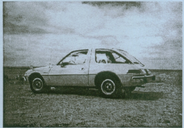
AMC Pacer D/L 1975