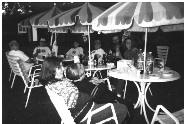
Grillparty! Utomhus i den ljumma sommarkvällen