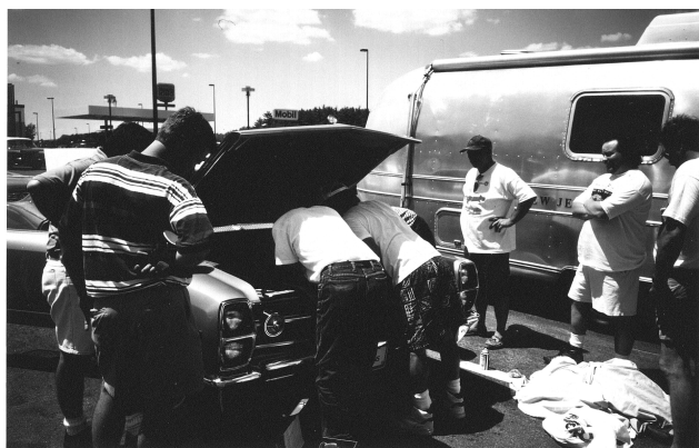
Gruppmekning längs Massachusetts turnpike

Vi lyckades ta oss fram till avtalad mötesplats genom att rulla i utförlöpora och bara använda sparsamt med kraft på rakor och uppförsbackar. Hela tiden följde den Svarta bilen oss i hasorna med hot om en rejäl knuff i röven om inte fisken skötte sig.