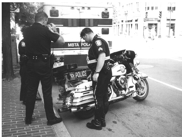
Dom HD burna poliserna i Boston var trevligare än deras kompis från Highway patrol.

Detta var det absolut svettigaste på hela resan, jag var tvärsäker på att vi skulle bli stoppade. Men som tur var passerade vi strax därpå delstatsgränsen mellan New York och Massachusetts, så nu var det nya snutars tur att ta över kontrollen längs vägen, det kändes skönt för jag hade ingen lust att träffa vår kompis någon mer gång.