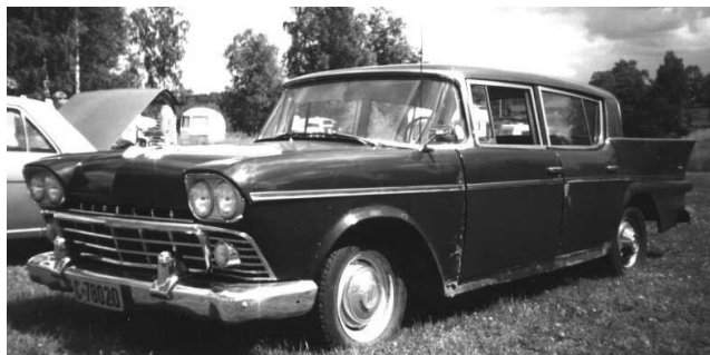
50-TAL: Rambler Super Six -58, Frode Wingeng Norge

På lördagen droppade resterande besökare in. Allt som allt så kom det 18 bilar, varav 17 var med på utställningen. Det fanns både -50,-60,-70 och -80-talare representerade.