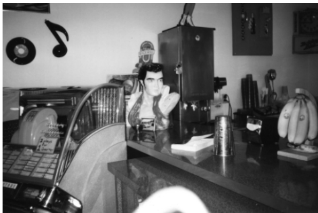
Jukeboxen vaktas av Elvis på restaurang "Bobby's girl".

Nu gällde det att hitta ett motellrum. Dumt nog hade vi inte förbokat, utan räknat med att hitta ett rum längs vägen. Nu är det så att helgen kring den 4:e juli (USAs nationaldag) är alla som kan lediga och man firar med förkärlek på någon vacker plats. Så det visade sig vara mycket svårt att hitta ett ställe att övernatta på. Vi följde den synnerligen vackra väg 11, längs Lake Winnepesaukees västra strand mot Weirs Beach. Det fanns gott om motell, men överallt satt det skyltar med texten "NO VACANCY".