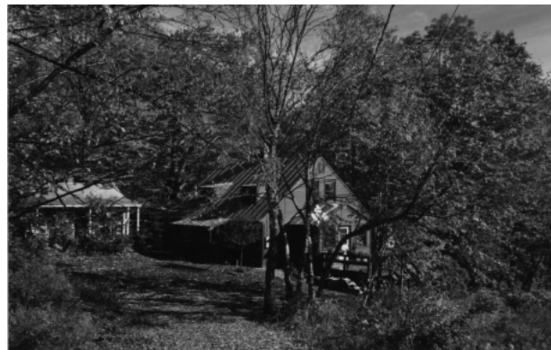
Tant Hedwigs lilla stuga var från 1700-talet.

I den lilla byn fanns också två stycken restauranger, som enligt det äldre paret hade mycket gott rykte. Det kändes otroligt skönt att både ha fått tag på ett rum för natten, och en mekaniker med gott renommé.