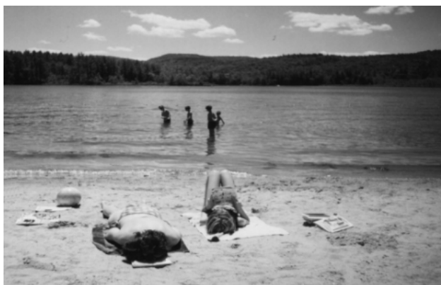
Pemmi Shore beach.