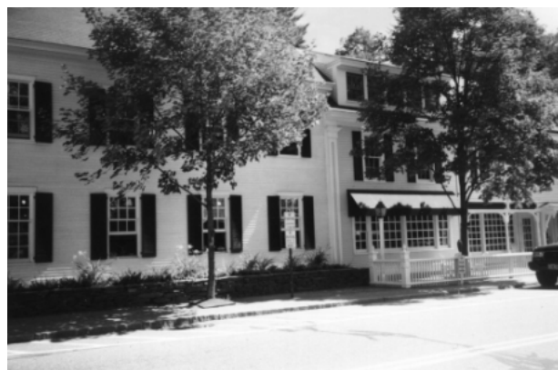
Vackra New England hus såg vi i den lilla staden Woodstock.